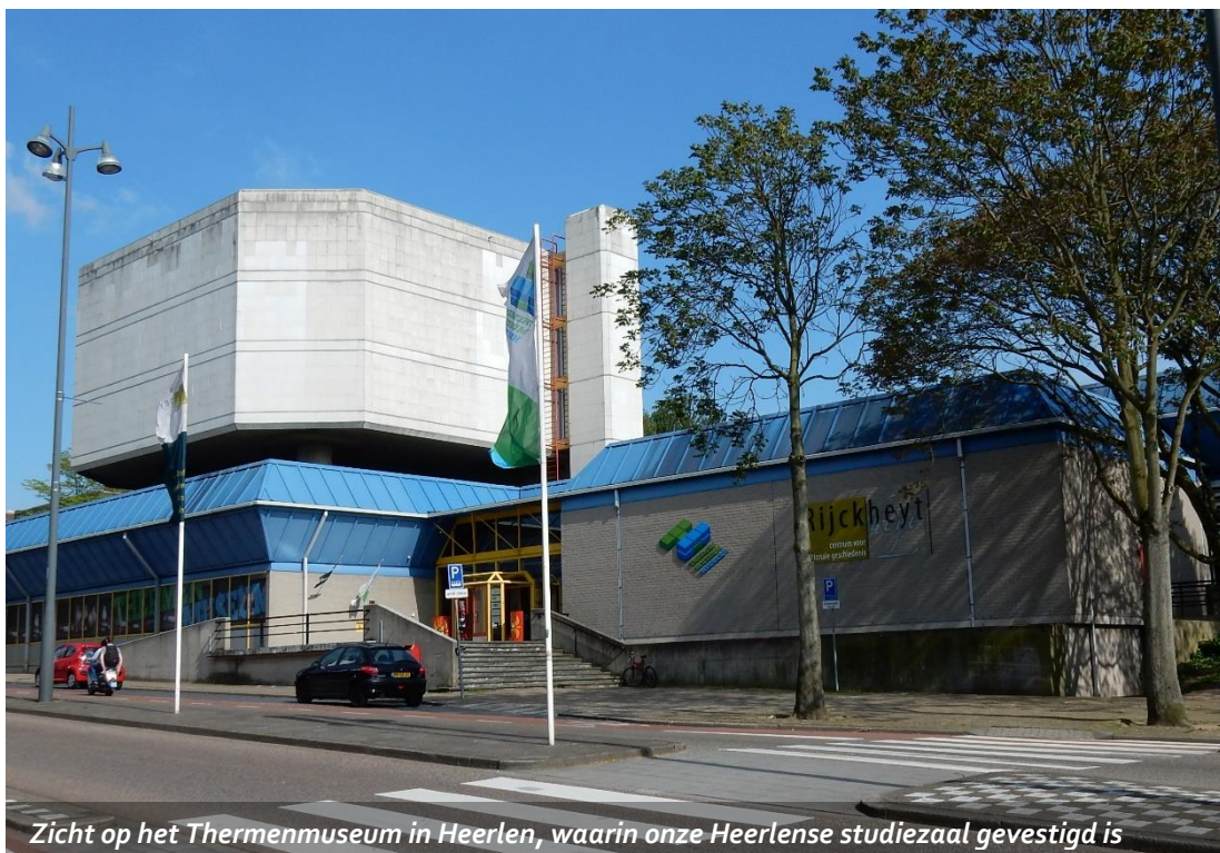
Zicht op het Thermenmuseum in Heerlen, waarin onze Heerlense studiezaal gevestigd is

De locatie Heerlen is gevestigd in het Thermenmuseum aan de Coriovallumstraat. Het onderhoud valt onder de verantwoordelijkheid van de Gemeente Heerlen.