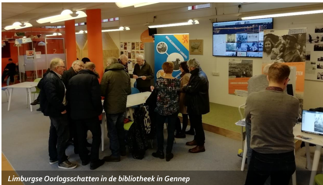
Limburgse Oorlogsschatten in de bibliotheek in Gennepe

Tussen september 2019 en maart 2020 stond Limburg in het teken van de 75-jarige herdenking van oorlog en bevrijding. Om die reden hebben we het programma 'Limburgse Oorlogsschatten' in het leven geroepen. Achter dit programma schuilen drie projecten met een gezamenlijk doel: zoveel mogelijk Limburgse oorlogsschatten verzamelen, ontsluiten en beschikbaar maken voor het grote publiek. Hieronder worden deze projecten kort uiteengezet.