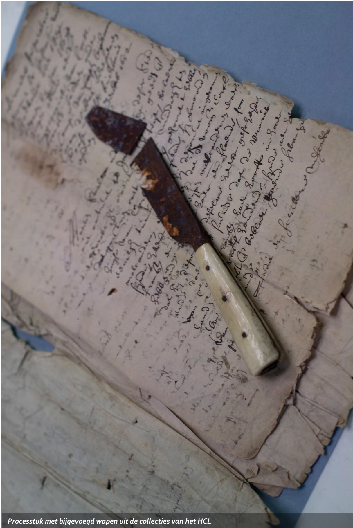
Processtuk met bijgevoegd wapen uit de collecties van het HCL