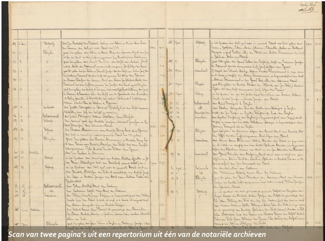
Scan van twee pagina's uit een repertorium uit één van de notariële archieven

Binnen het project DTR3 (Digitale Taken Rijk) worden minuutakten en repertoria van in Limburg gevestigde notarissen (archieffcodes 09.001 en 09.008) en van Maastrichtse notarissen (archieffcodes 20.242A en 20.243A) gedigitaliseerd. In 2020 is de zesde tranche van de Limburgse notarissen verzonden voor digitalisering. Dit betrof in totaal 344 dozen met daarin 834 inventarisnummers. Het eerste deel van de Maastrichtse notarissen (tranche 7) wordt momenteel voorbereid voor verzending.