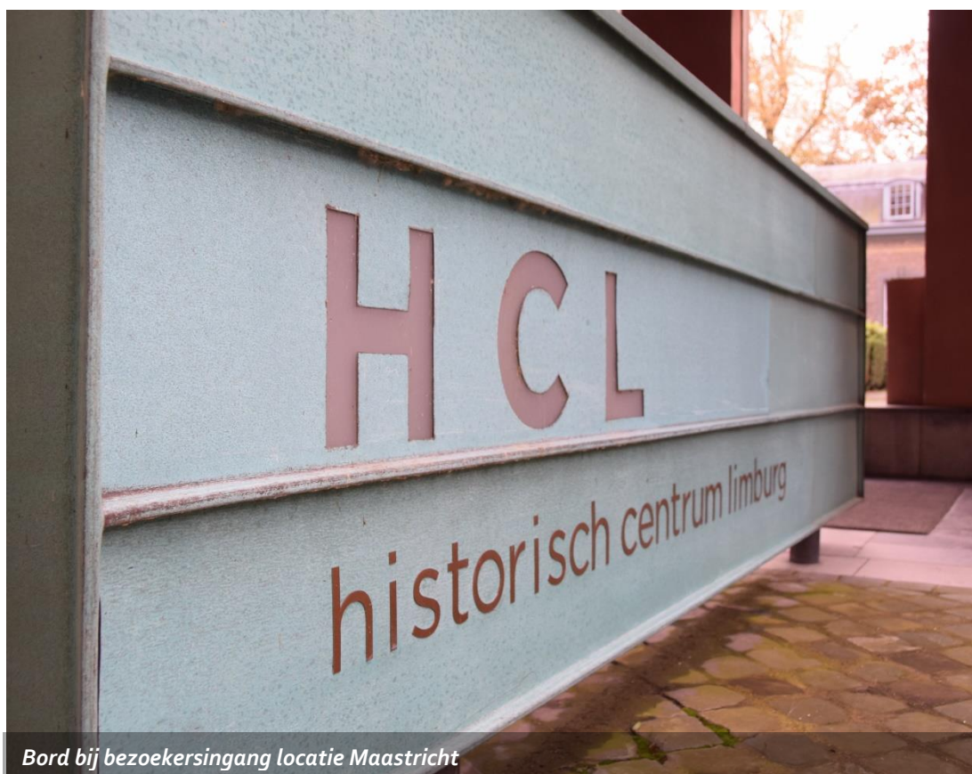
Bord bij bezoekersingang locatie Maastricht