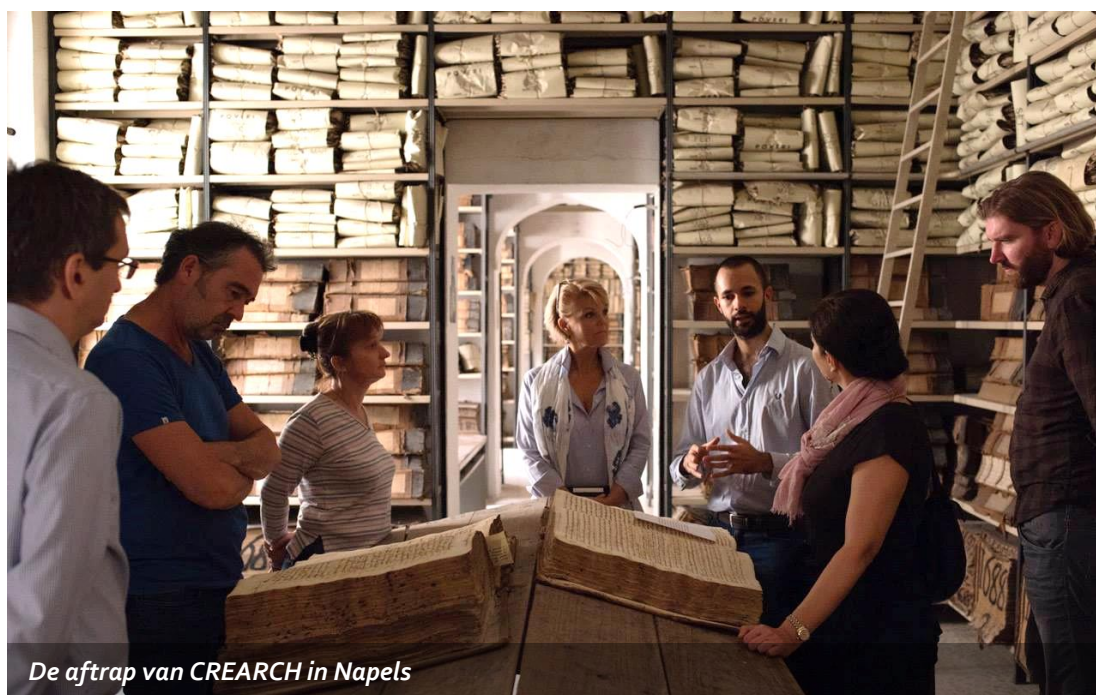
De aftrap van CREARCH in Napels

Het resultaat van deze pilot was een cursusboekje dat in het Engels werd vertaald en gedeeld met de internationale partners in ons project. Onze internationale partners hebben gedurende 2020 van het resultaat gebruik gemaakt om de cursus verder door te ontwikkelen.