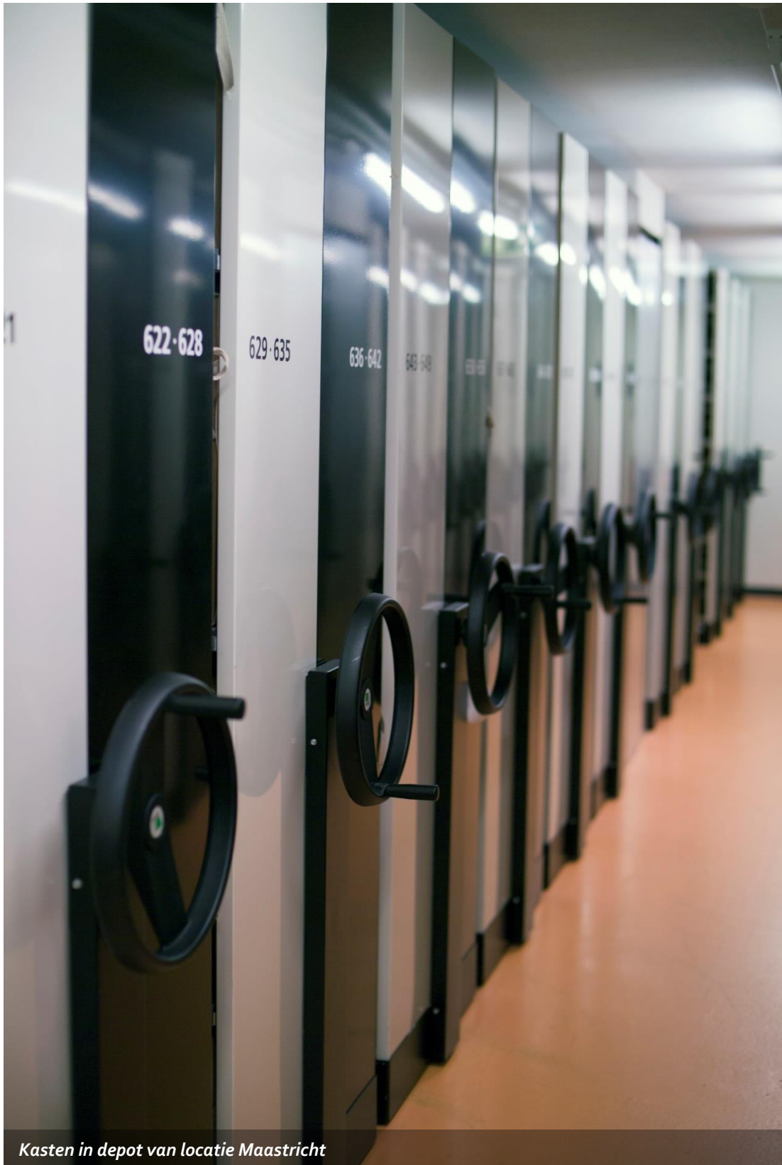
Kasten in depot van locatie Maastricht